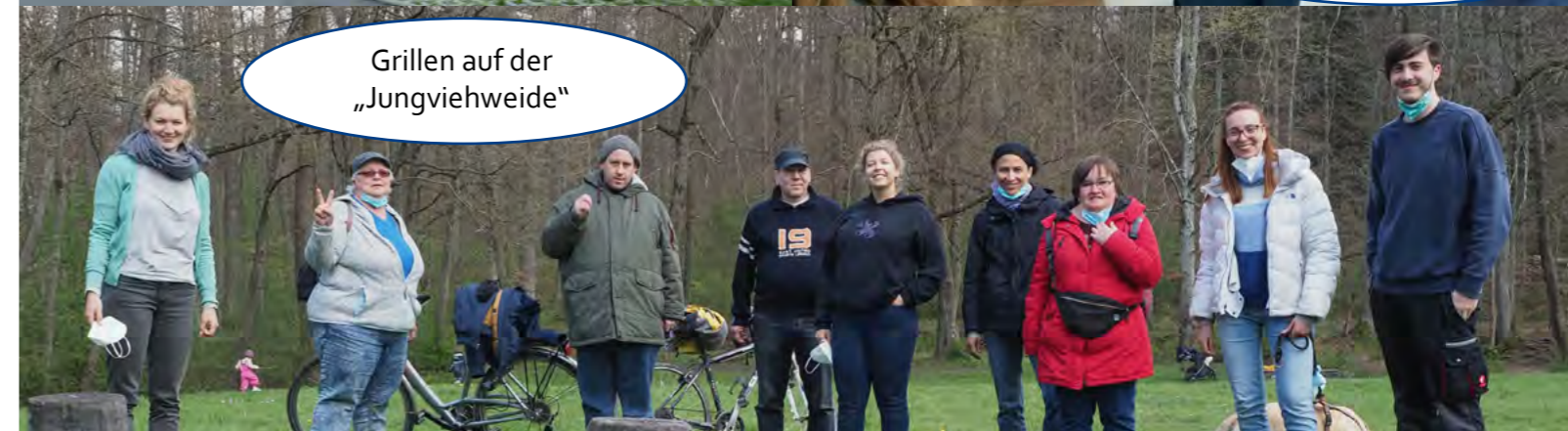
Grillen auf der „Jungviehweide“