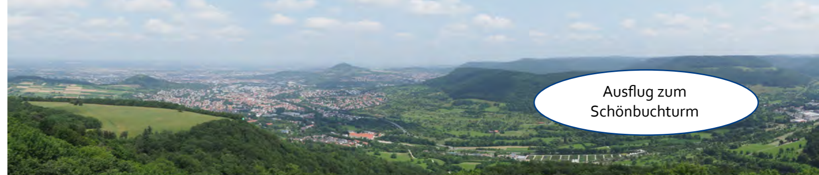
Ausflug zum Schönbuchturm