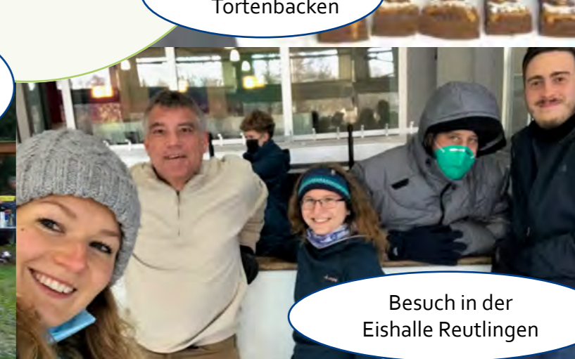
Besuch in der Eishalle Reutlingen