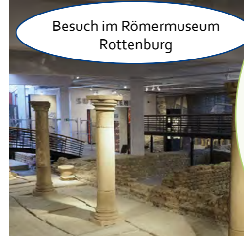
Besuch im Römermuseum Rottenburg