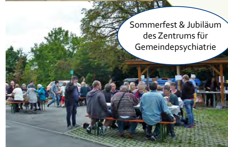
Sommerfest & Jubiläum des Zentrums für Gemeindepsychiatrie