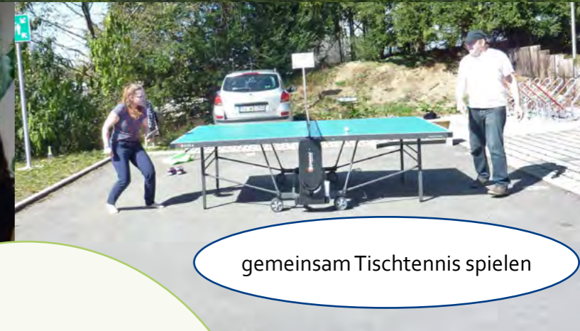
gemeinsam Tischtennis spielen