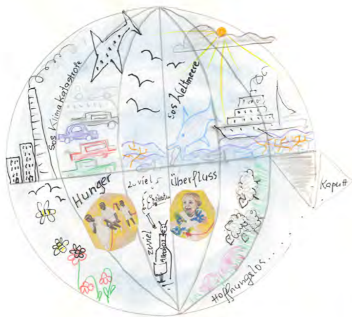
Eine Illustration zum Jahresthema von Angela Manay (AWS Esslingen)